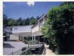
草津 片岡鶴太郎美術館