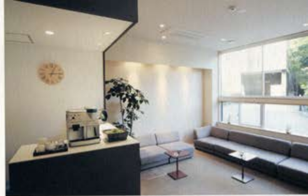
1階玄関脇のラウンジ