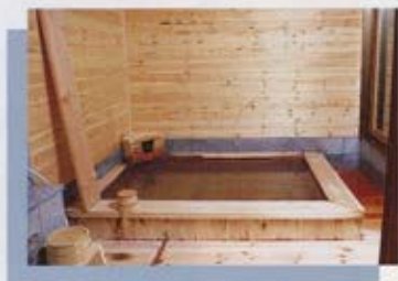
総檜庭園貸切風呂