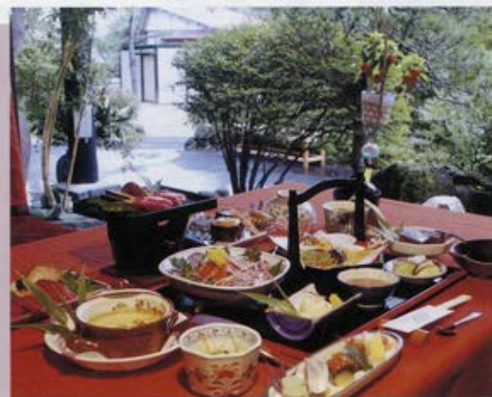
旬の味覚と大切にしてお料理