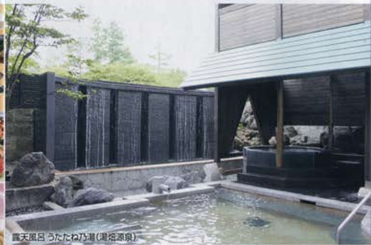
露天風呂 うたたね乃湯(湯畑源泉)