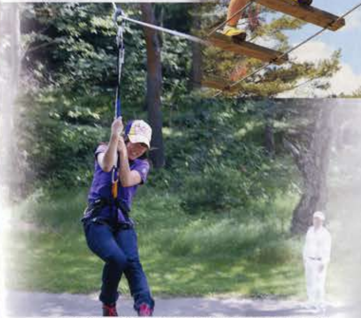
全長640m、42のアトラクション「草津フォレストステージ」 (3月下旬～12月初旬)