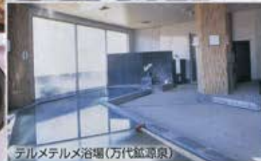
テルメテルメ浴場(万代鉱源泉)