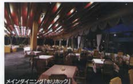
メインダイニング「ホリホック」