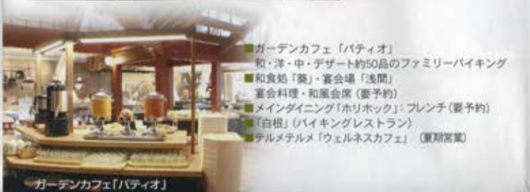
ガーデンカフェ「パティオ」

近郊農家直送の野菜、地元上州の素材、沼津港直送の新鮮魚介をハイキング・フレンチ・日本料理の多彩なメニューでご用意いたします。