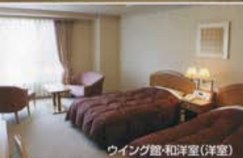
ウイング館-和洋室(洋室)