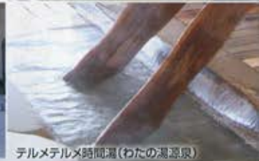
テルメテルメ時間湯(わたの湯源泉)