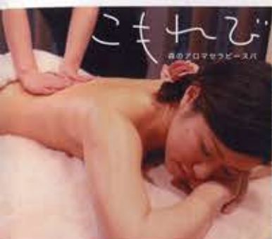
●森のアロマセラピースパ「こもれび」 (シャトー1階1F)