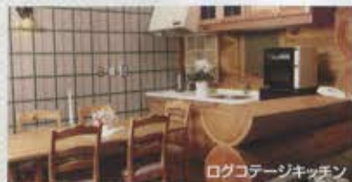
ログコテージキッチン

海拔1200m・白樺やカラマツが美しいベルツの森。四季折々の豊かな自然に囲まれゆっくりとお寛ぎ頂けます。