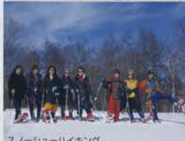
スノーシューハイキング

温泉街の名所・歴史、豊かな自然 を楽しむウォーキングガイド や、年間1万人以上のお客様が参加 する朝の森林浴散策など、ゆった りと自然を歩くことで心も体も癒 されます。