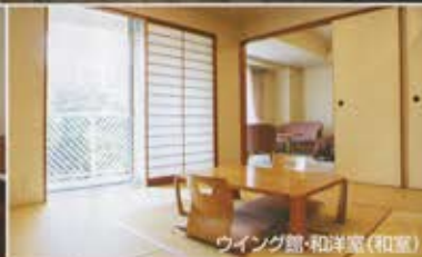
ウイング館-和洋室(和室)