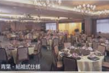
青葉・結婚式仕様

大きな宴会場と、様々なスタイルでお楽しみいただけるお料理。同窓会・職場旅行・懇親会・お食事会・披露宴・法要、様々なシーンでご利用ください。