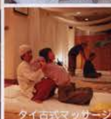
タイ古式マッサージ