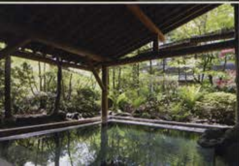
広々とした大浴場。外には大露天風呂。 (14時～22時 女性・22時～10時 男性)

熱めとぬるめ 2つの湯船のある中浴場。 外には中露天風呂。 (14時～22時 男性 22時～10時 女性)