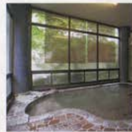
さいせん 賽泉の湯

熱めとぬるめ 2つの湯船のある中浴場。 外には中露天風呂。 (14時～22時 男性 22時～10時 女性)