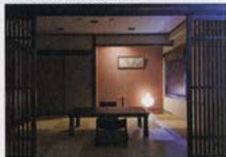
デザインルーム「黄昏の和」(たそがれのわ)