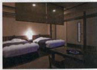
デザインルーム「藍の美路」(あいのみち)