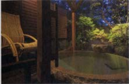
離れの貸切露天風呂 石づくりの湯「石桶花」