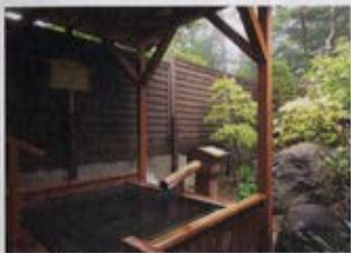
離れの貸切露天風呂 木づくりの湯「木蓮」