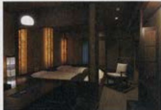
デザインルーム「山吹の野」