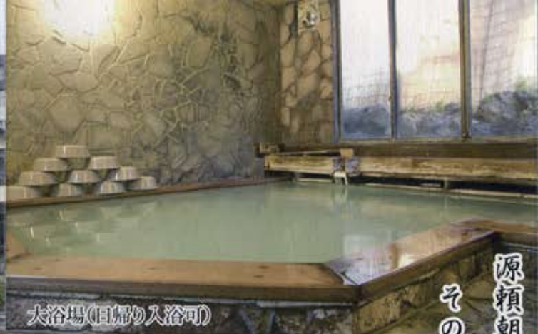
大浴場(日帰り入浴可)