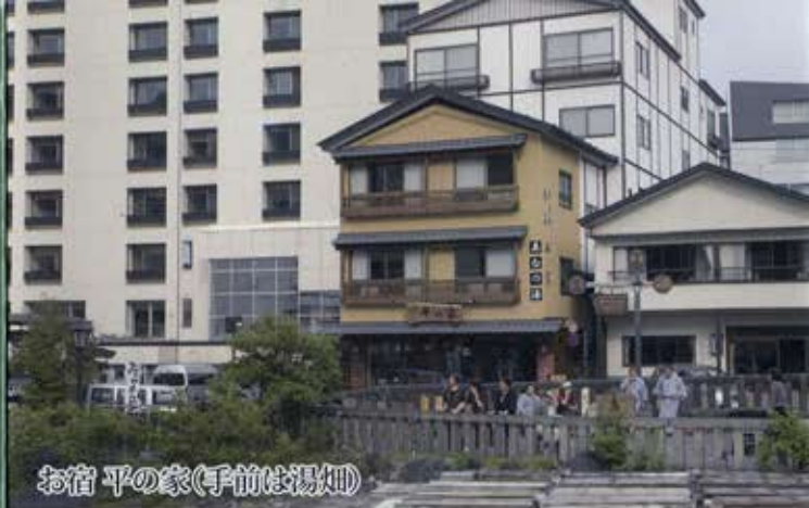
お宿 平の家(手前は湯畑)